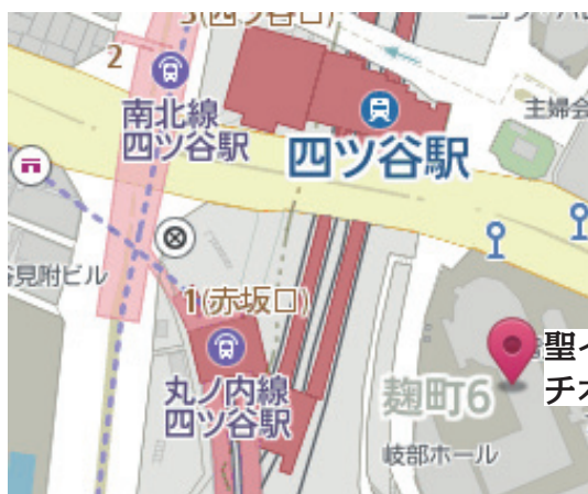
聖イグナチオ教会