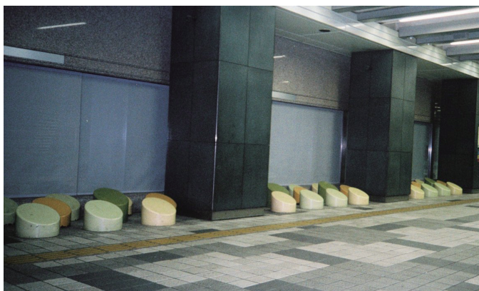
しんじゅくえきにしぐちかどう 新宿駅西口地下道