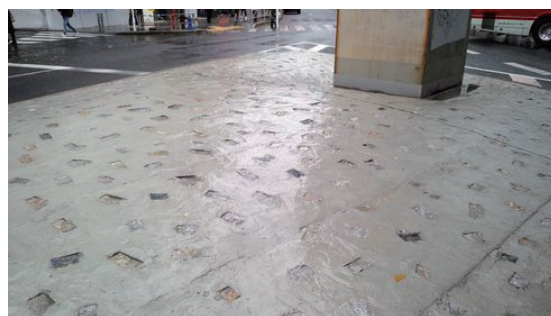
うえ しゃしん はいじよ もくてき 上の写真のオブジェは、排除を目的 にしているとの指摘に、2、3日後 に突起物だけが撤去された

「アートの体裁をとりつつ、ホームレスの起居を防止するオブジェ」を指す言葉として命名された〈排除アート〉。都の担当者は「オブジェにホームレス対策の意図はない」と語るが、「実質的にホームレス排除に加担している」。たとえば左上の〈作品〉。新宿駅西口から都庁方面に向かう地下道の通路脇には、カラフルなオブジェがずらっと並んでいる。座面が斜めにカットされ、しかも交互に設置されているので、座ることも、寝ることもできない。じつに巧妙に計算されています。座れないイス、横たわれない突起物に「心のトゲ、を見てとるのは私だけでしょうか。