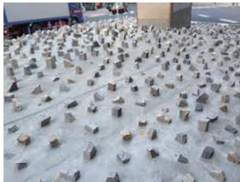
しぶや しゅとこうこうかした しよくさいたい 渋谷の首都高高架下。植栽帯がア トと称するオブジェに変身